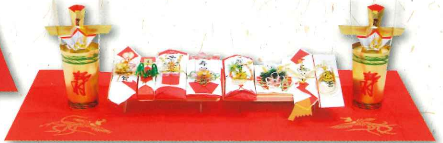
松 9品 2台タイプ 37,000円(税込)