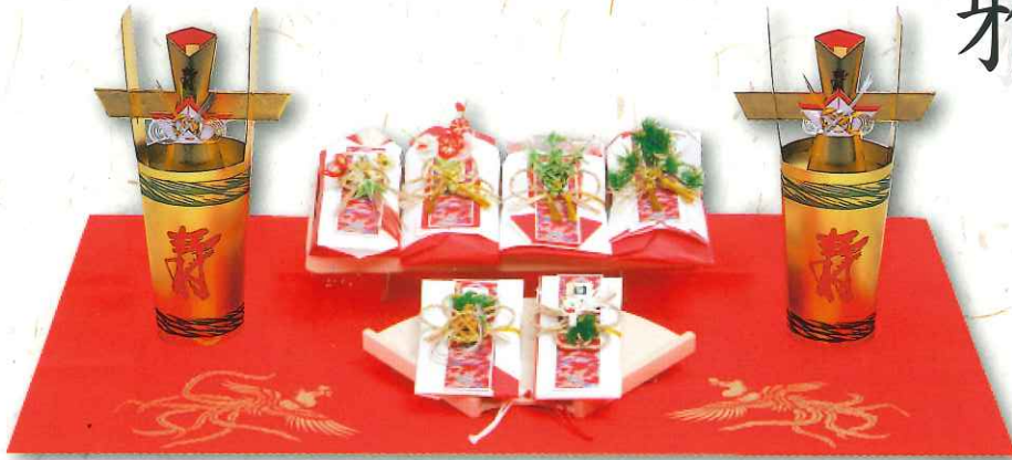
雅 7品 前後タイプ 41,500円(税込)