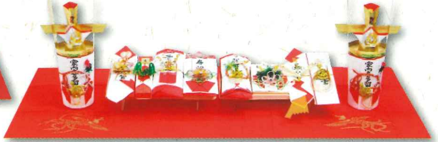
曙 9品 2台タイプ 43,500円(税込)