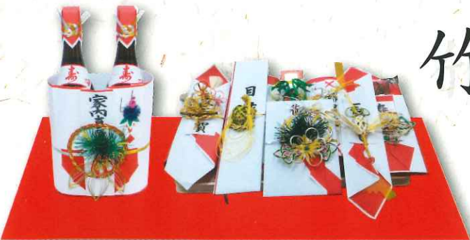
竹 9品 1台タイプ 34,000円(税込)