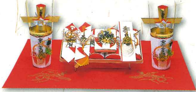
曙 9品 1台タイプ 42,500円(税込)