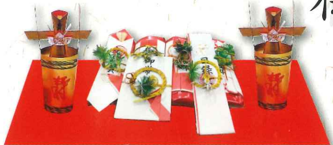
梅 7品 1台タイプ 34,000円(税込)

商品内容 勝男節 (鯉節*雄節・雌節)、寿留女 (するめ*雄・雌)、友白賀 (そうめん)、子生婦 (こんぶ) 家内喜多留 (または角樽)、御帯料 (結納金)、目録、付属で敷物、白木台、寿ふろしき、末広(扇子) ※ 、長のし ※